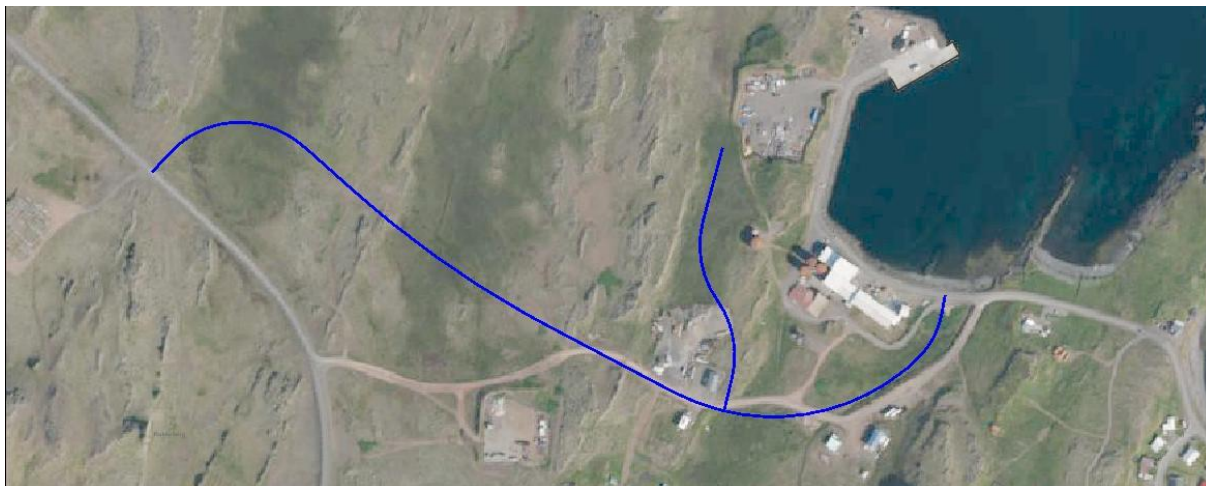
Mynd 1: Fyrstu drög af nýrri veltengingu við þéttbýlið. Nýir vegir eru sýndir með bláum línun.

Til stendur að fara í framkvæmdir við hreinsivirki, lagningu nýrra fráveitulagna og gerðar nýrrar útrásar til að bæta meðhöndlun og hreinsun skólps frá íbúabyggð og atvinnustarfsemi (sjá mynd 2). Við framkvæmdirnar verður haft að leiðarljósi að taka tillit til staðhátta, lágmarka sjónræn (neikvæð) áhrif, og að umhverfisfrágangur og ásýnd verði til fyrirmyndar.