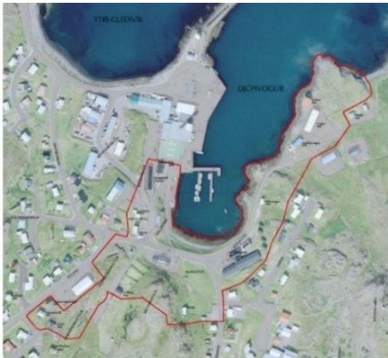
Mynd 3: Afmörkun verndarsvæðis í byggð.

Í gildi eru skilmálar fyrir verndarsvæðið við vögin sem gera ráð fyrir samþættri verndun þ.e. verndun menningarsögulegrar byggðar haldist í hendur við breytingar innan verndarsvæðis og takið mið að því að styrkja varðveislugildi einstakra þátta byggðar (sjá mynd 3). Skilmálum má í grófum dráttum skipta í tvennt. Annars vegar skilmálar sem taka til þess sem nú þegar á svæðinu þ.e. hús, mannvirki, umhverfi og almannarými. Síðan hins vegar nýrrar uppbyggingar innan svæðisins 8 . Þar sem gert er ráð fyrir að allar framkvæmdir við fráveitu innan verndarsvæðisins í byggð verði í eða við götur og gangstéttir, verður fjallað um áhrif þess í skipulagsbreytingunni ef þurfa þykir.