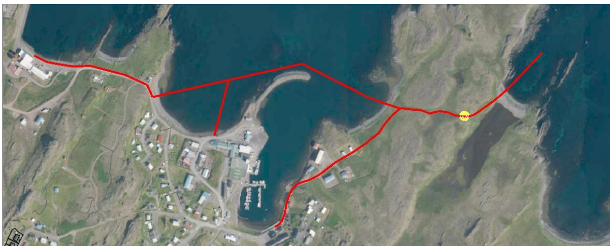
Mynd 2. Fyrstu drög af nýjum fráveitumannvirkjum. Fráveitulagnir eru sýndar með rauðum línun og staðsetning skólphreinsistöðvar með gulum punkti.

Til stendur að fara í framkvæmdir við hreinsivirki, lagningu nýrra fráveitulagna og gerðar nýrrar útrásar til að bæta meðhöndlun og hreinsun skólps frá íbúabyggð og atvinnustarfsemi (sjá mynd 2). Við framkvæmdirnar verður haft að leiðarljósi að taka tillit til staðhátta, lágmarka sjónræn (neikvæð) áhrif, og að umhverfisfrágangur og ásýnd verði til fyrirmyndar.