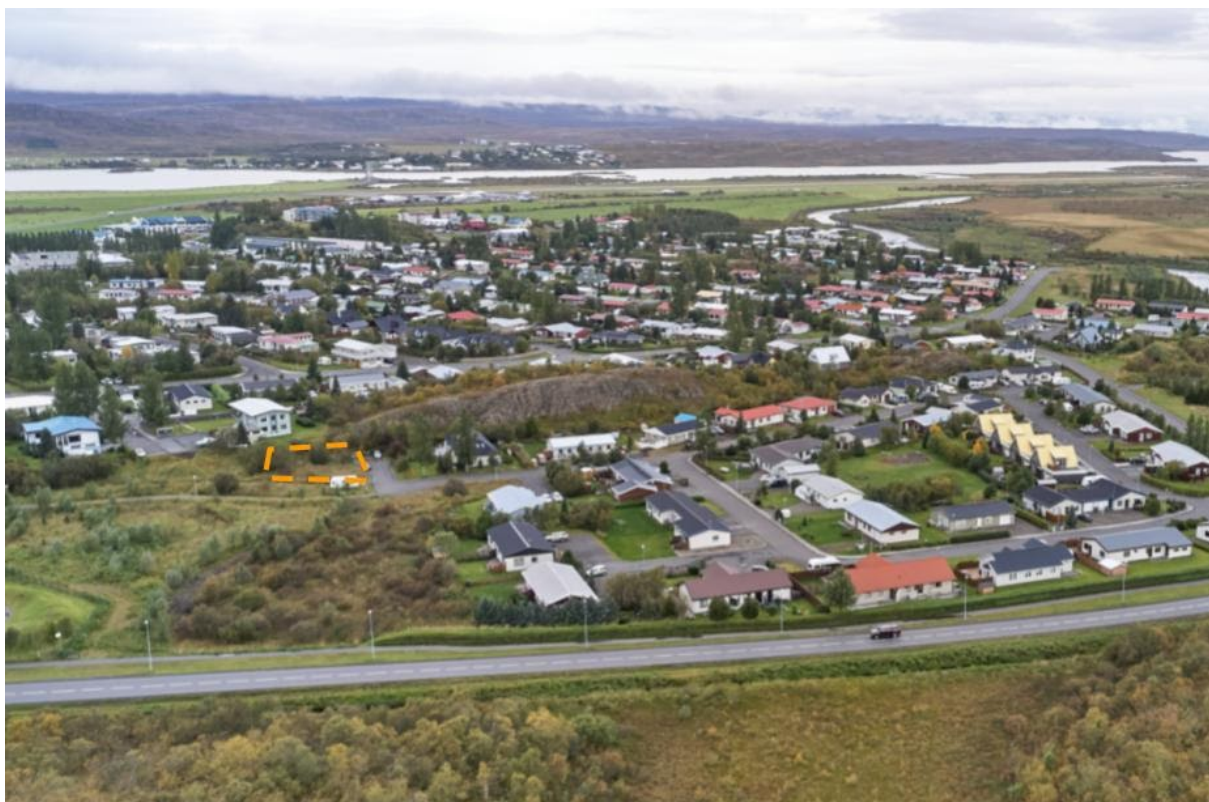
Fyrirhuguð lóð við Einbúabla, afmörkuð með gulri brotalínu.