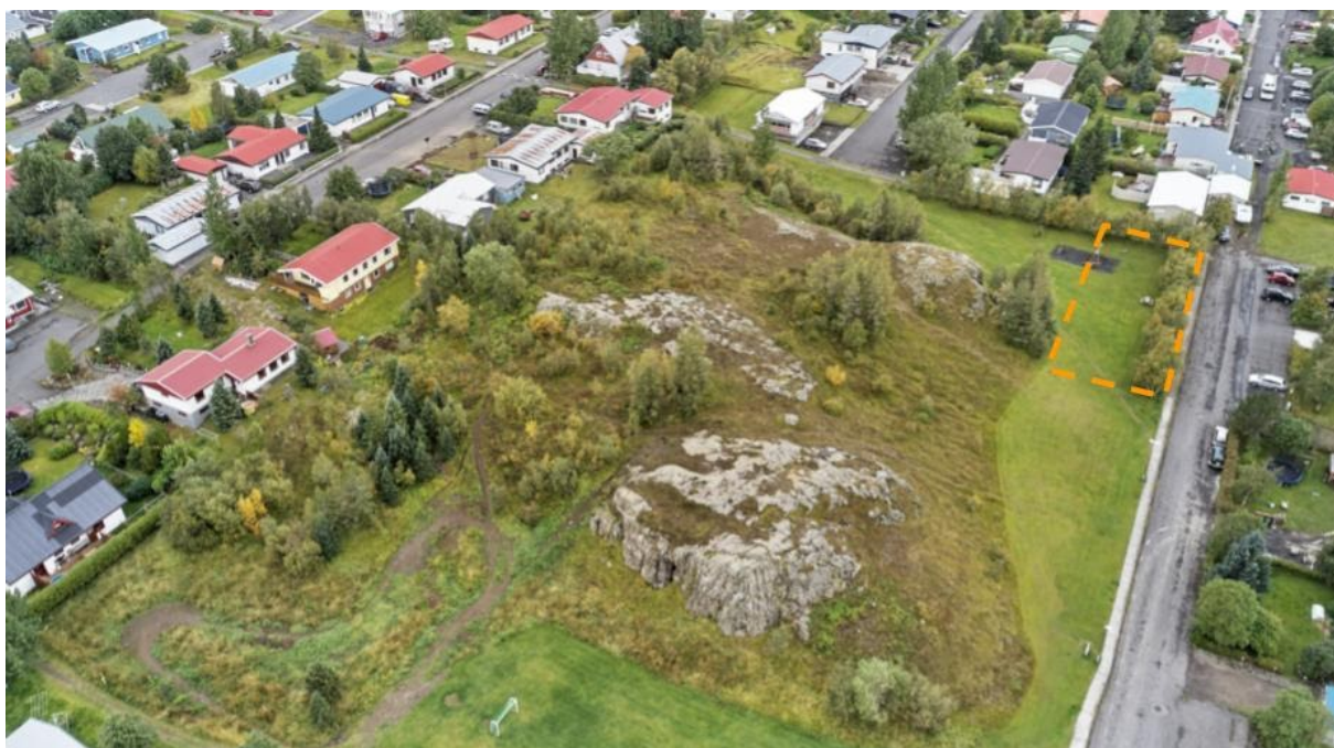
Fyrirhuguð lóð við Mánatröð, afmörkuð með gulri brotalínu.