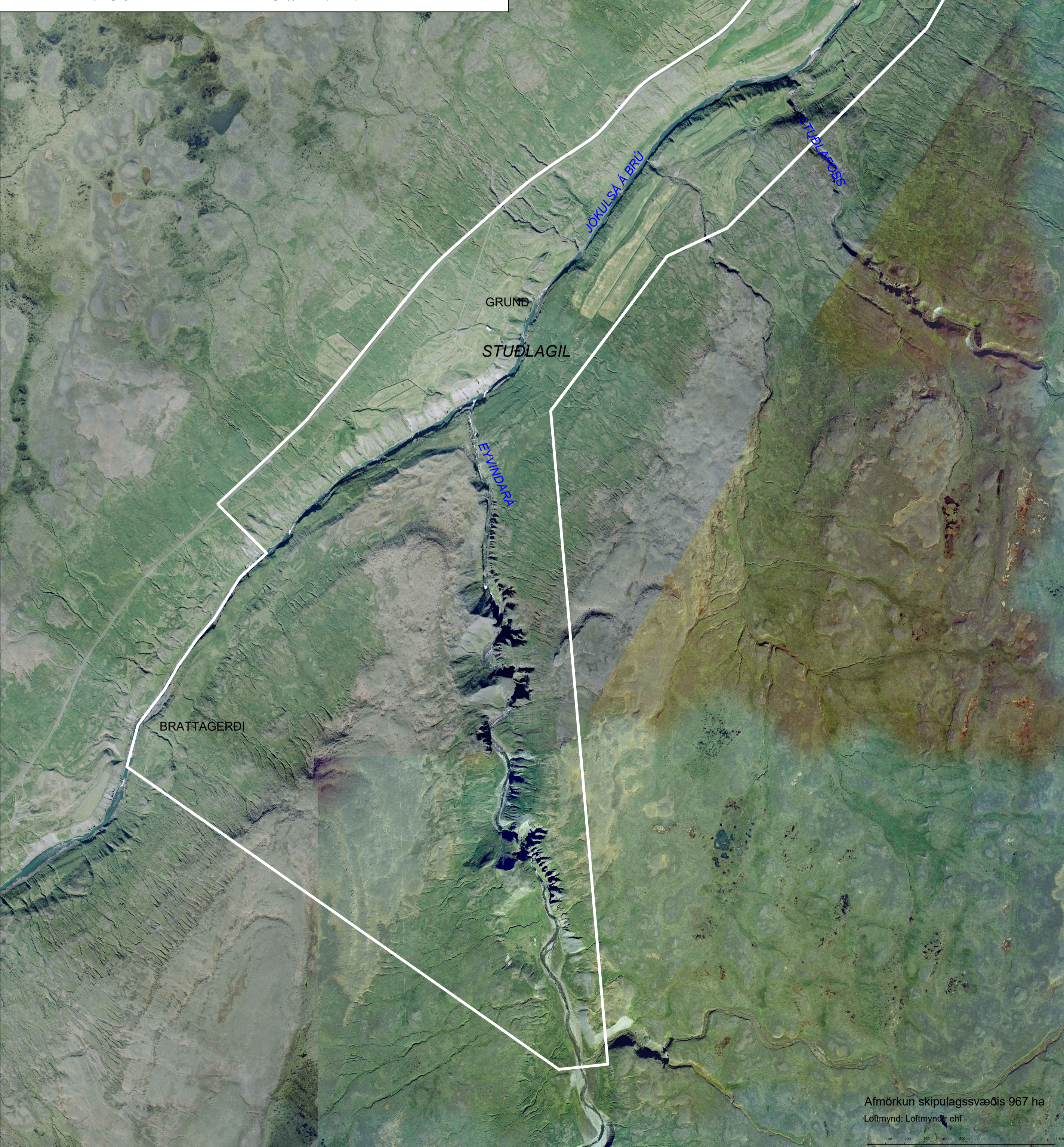
Afmörkun skipulagssvæðis 967 ha