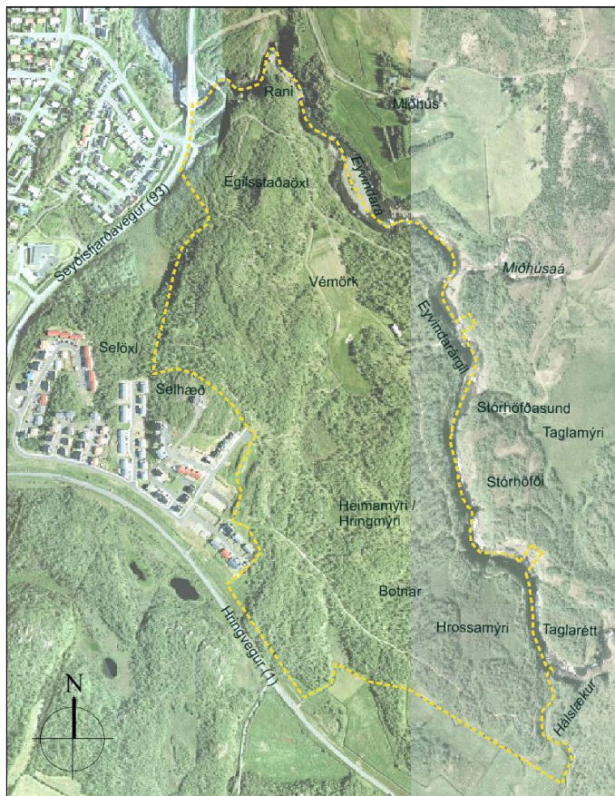
Mynd 1: Mörk skipulagssvæðis (gul brotalína)

Þess ber að geta að skipulagsmörkin ná yfir Eyvindará á tveimur stöðum (sjá mynd 1).