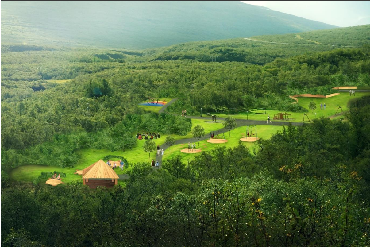
Mynd 10: Hugmyndir að afþreyingu í Vémörk. Dæmi um hönnun svæðisins (BLP)

Vémörk (Á4) – Í Vémörk er gert ráð fyrir aðal dvalarsvæði skógarins. Þangað eru góðar tengingar frá báðum bílastæðum eftir aðalstíg sem liggur í hring í skóginum. Svæðið í dag er að mestu grasflöt með nokkrum leiktækjum. Þéttur gróður er umhverfis svæðið allt en rýmismyndun á flötinni lítil. Gert er ráð fyrir að hluti svæðinu verði skipt upp í minni rými með gróðri svo skapa megi skjól fyrir hvössum vindi bæði úr norðurátt og að suðaustan. Þá er gert ráð fyrir að haldið verið eftir hluta af grasflötinni til hlaupa- eða boltaleikja þar sem ekkert hindrar umferð. Stefnt skal að því að notast við sterkbyggða runna frekar en há tré til að koma í veg fyrir mikla skuggamyndun. Gert er ráð fyrir endurbættri salernisaðstöðu, ruslaflokkun, grillskýli og leiksvæðum.