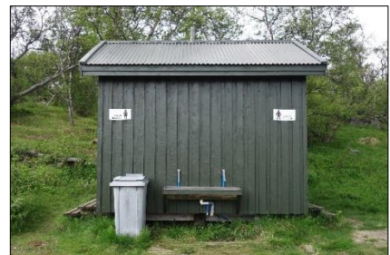
Mynd 6: Salernisbygging í Vémörk

Utan og austan til í Selskógi á gömlu, framræstu túni er gamall samkomustaður sem nefnist Vémörk. Þar hafa verið haldnar fjölmennar íþrótt- og skemmtisamkomur í gegnum tíðina. Í dag má þar finna ýmis leiktæki fyrir börn og fullorðna. Lítið aðstöðuhús er í miðri mörkinni með fjórum vatnssalernum og aðgengi að vaski utan á byggingunni.