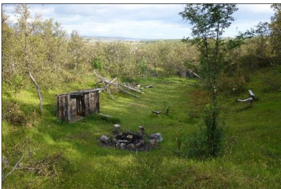
Mynd 7: Skátalundur

Útileikhús með bekkjum og sölubásar eru staðsettir í rjóðri