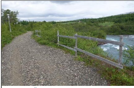
Mynd 5: „Öryggisgirðingar“ við fallhættusvæði