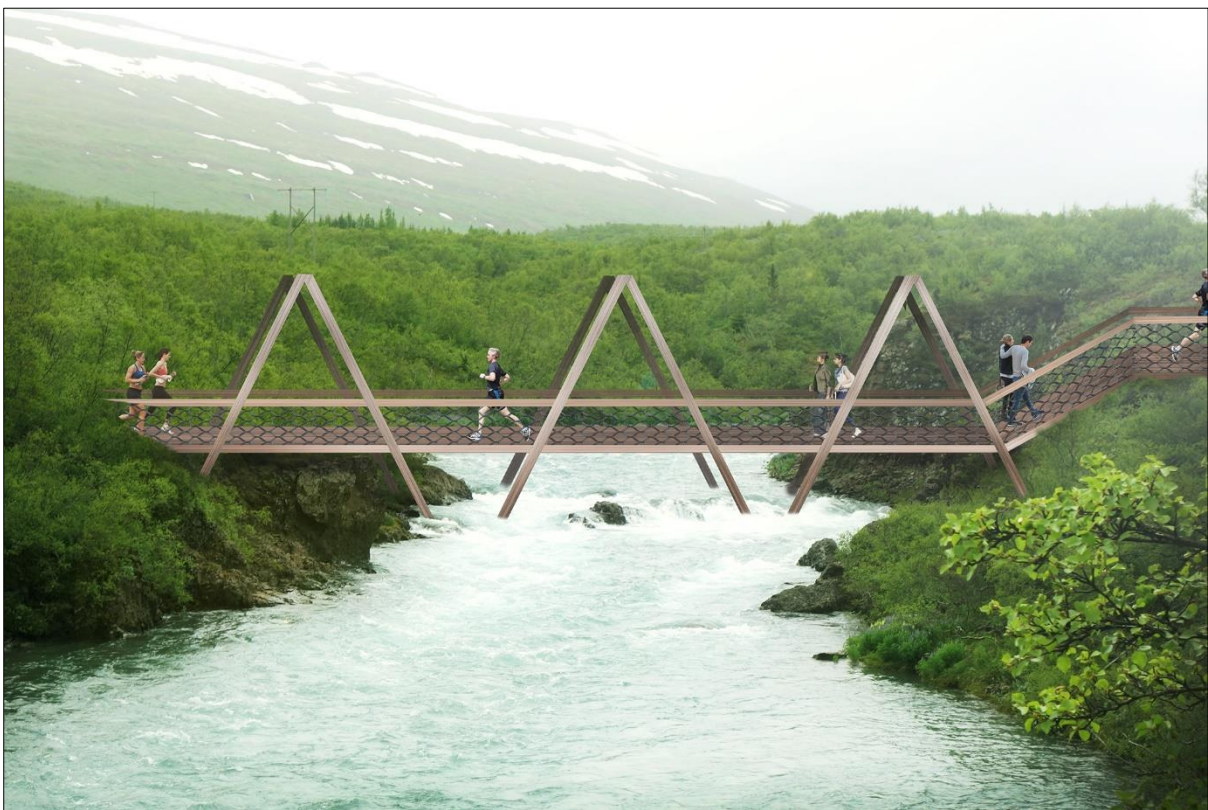
Mynd 11: Dæmi um útlit göngubrúar yfir Eyvindará (BLP)

Vegna byggingar á lóðum vísast til ákvæða þeirra laga og reglugerða sem við eiga, s.s. skipulags- og byggingarlaga, byggingarreglugerðar, skipulagsreglugerðar, reglugerða um brunavarnir og brunamál, íslenska staðla og RB-blaða Rannsóknarstofnunar byggingariðnaðarins eftir því sem við á.