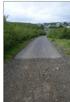
Mynd 3: Mörk malbiks og malarstígs við upphaf gönguleiðar

Aðalstígur liggur á kafla mjög nálægt snar- bröttum veggjum Eyvindarárgils og er þar töluverð fallhætta. Veikburða timbur girðingu hefur verið komið fyrir á sumum þessara staða.