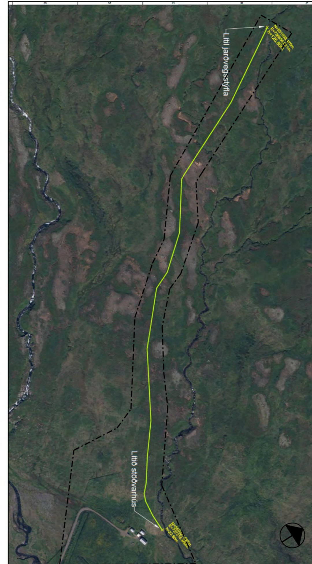
YFIRLITSMYND MKV. 1:4000